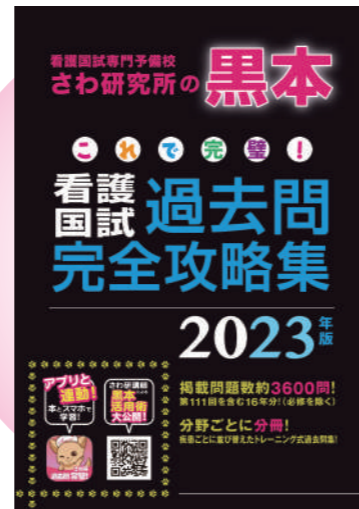
※画像は昨年度のものです。