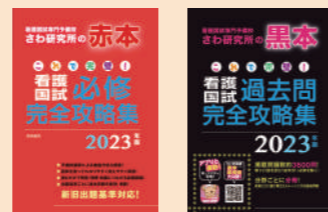
※画像は昨年度のものです。