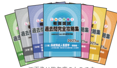
※画像は昨年度のものです。