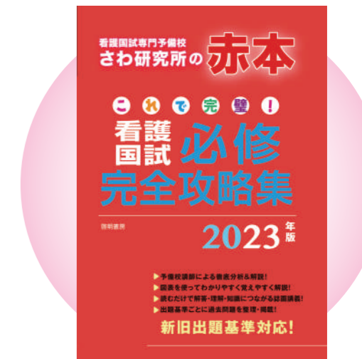
※画像は昨年度のものです。